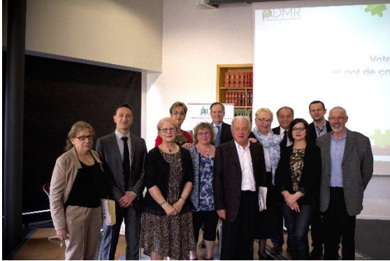
Assemblée générale de la Fédération ADMR 54, Conseil départemental 54